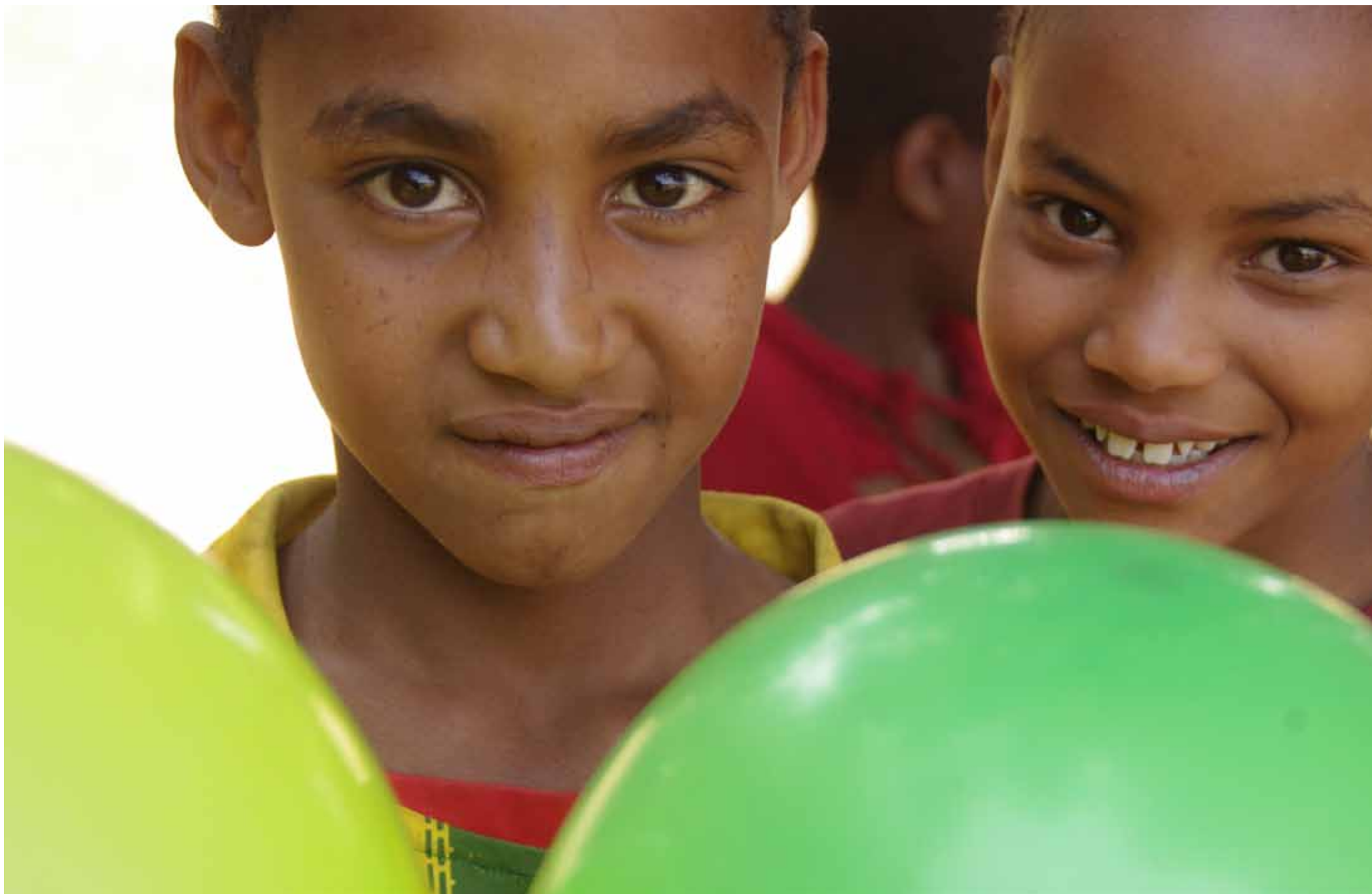
Etiopia - Emdibir, ragazzi di una scuola primaria / Aethiopien - Emdibir, Kinder einer Primarschule