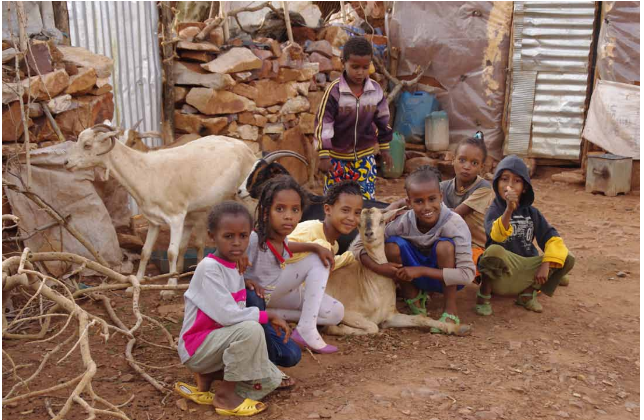
Etiopia - Bambini del campo profughi di Shire / Aethiopien - Kinder im Flüchtlingslager von Shire