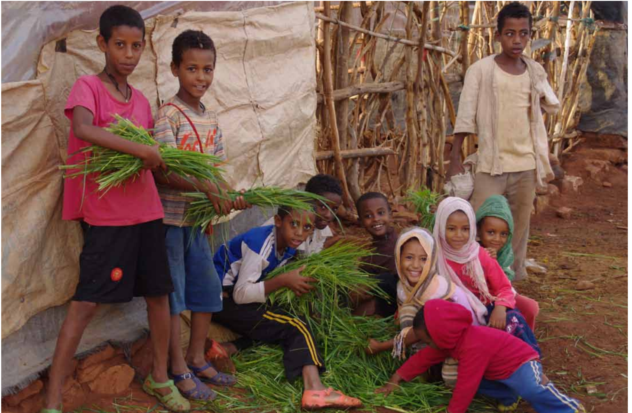
Etiopia - Bambini del campo profughi di Shire / Aethiopien - Kinder im Flüchtlingslager von Shire