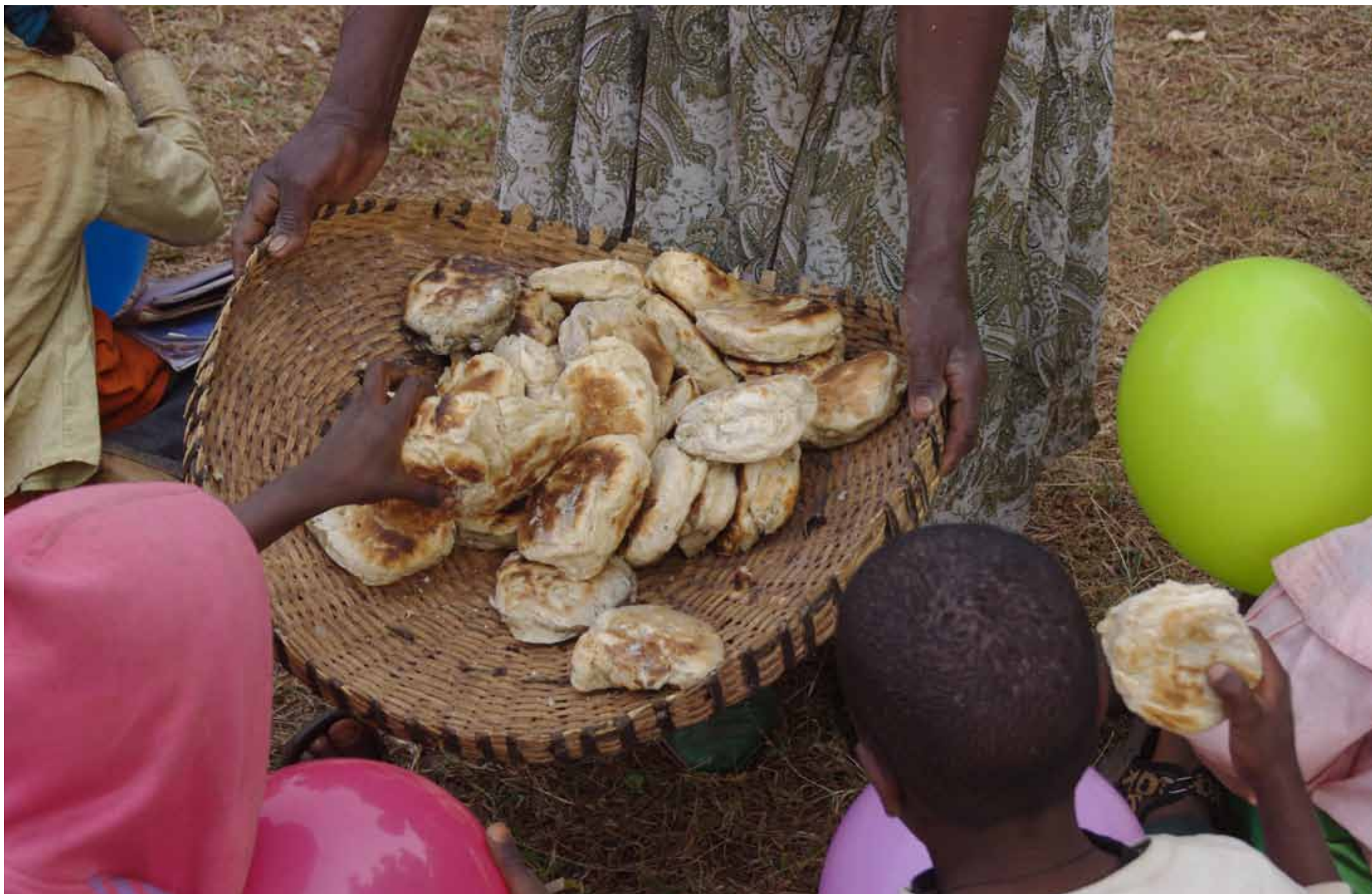
Etiopia - Dacci oggi il nostro pane quotidiano / Aethiopen - Unser tägliches Brot gib uns heute