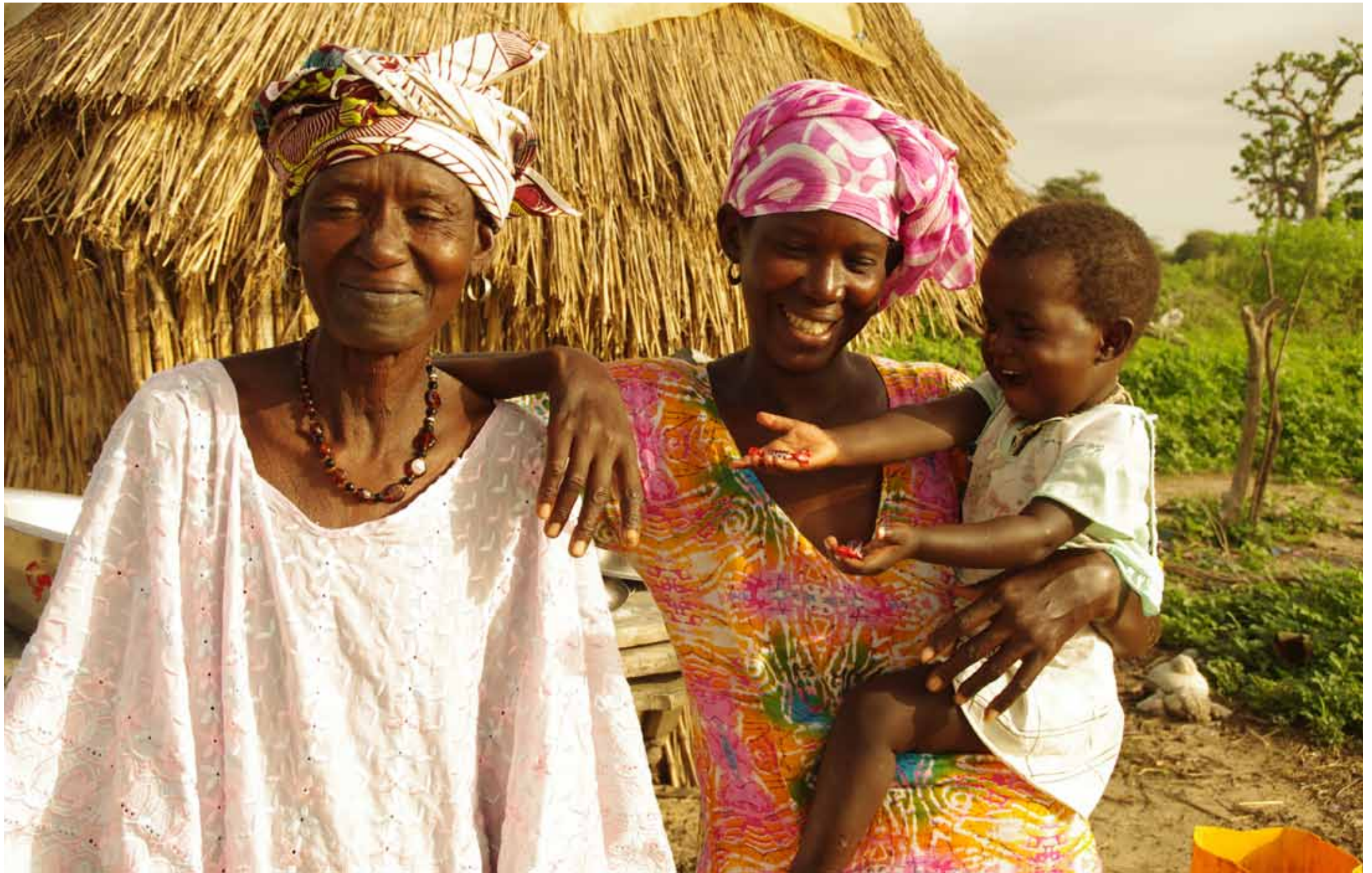
Etiopia - Scena di famiglia nella Valle dell'Omo / Aethiopien - Familienszene aus dem Omo-Tal