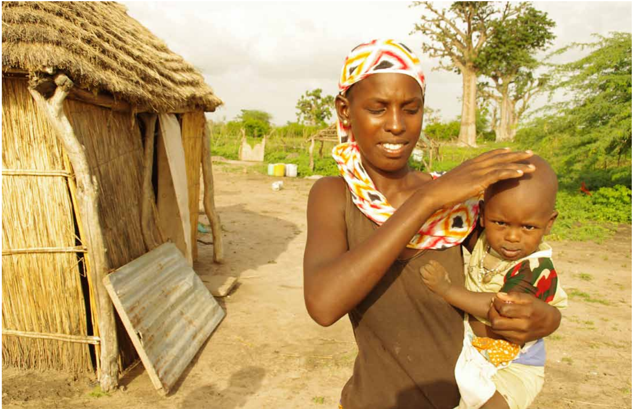
Etiopia - Madre e figlio della Valle dell'Omo / Aethiopien - Mutter und Sohn aus dem Omo-Tal