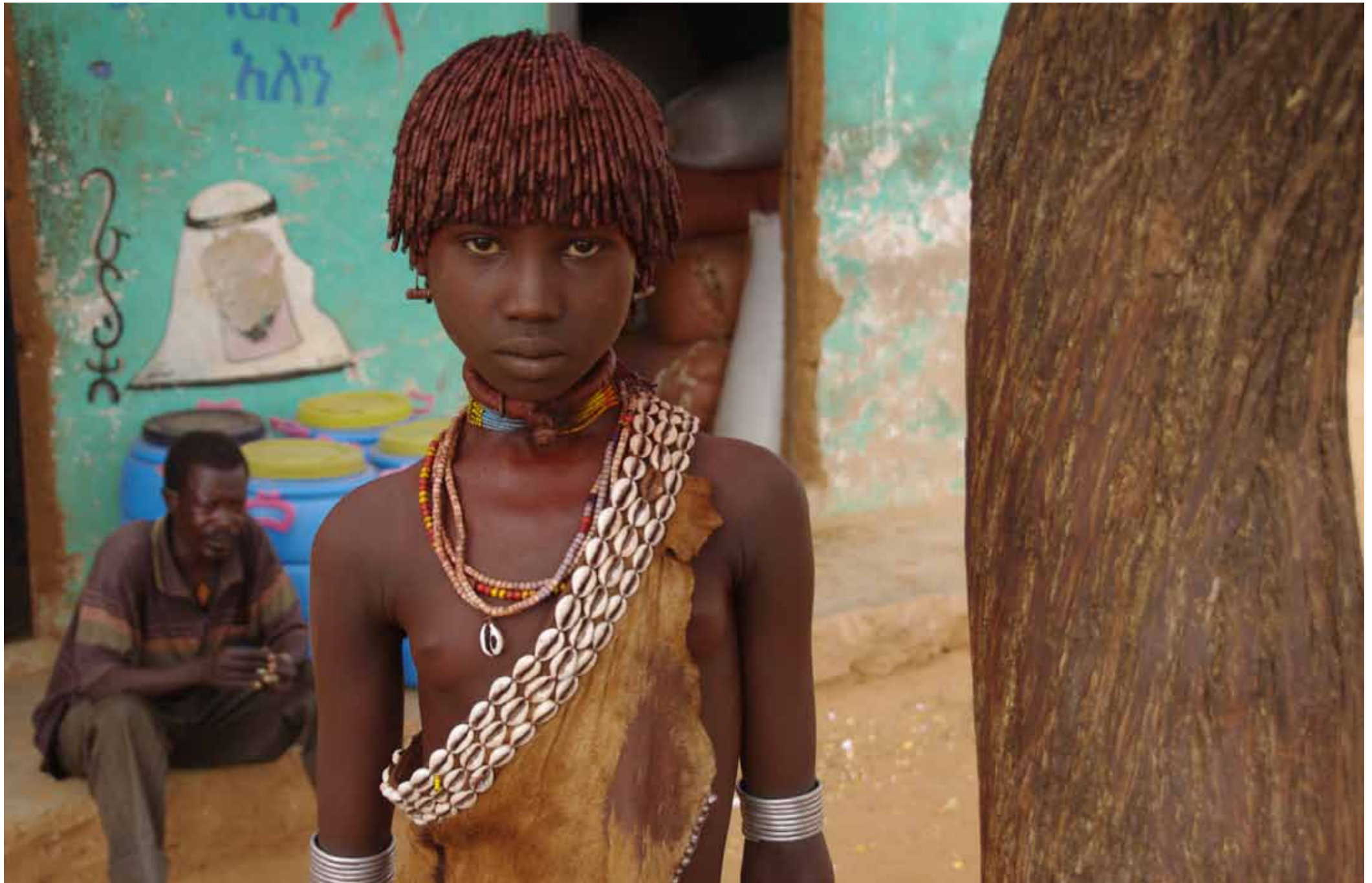
Etiopia - Giovane ragazza della etnia Hamar / Aethiopien - Junges Mädchen aus der Völkergruppe Hamar