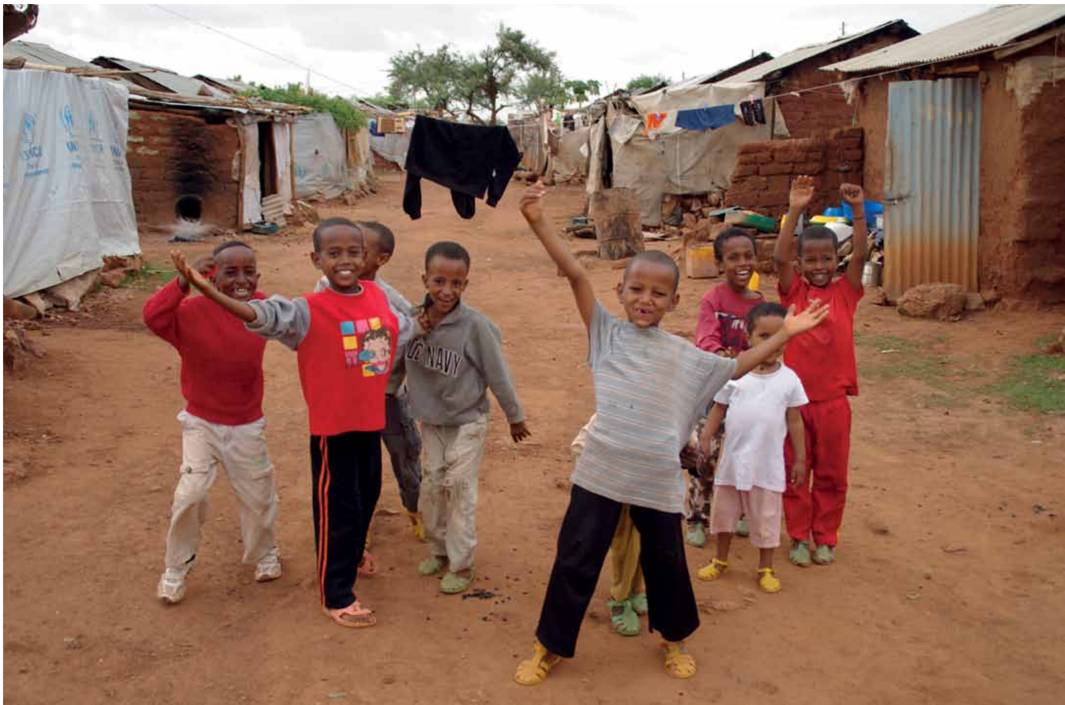
SOPRA / OBEN: BAMBINI DEL CAMPO PROFUGHI DI SHIRE / AETHIOPIEN - KINDER IM FLÜCHTLINGSLAGER VON SHIRE COPERTINA / UMSCHLAGBILD: ETIOPIA - BAMBINA CON FRATELLINO / AETHIOPIEN - MÄDCHEN MIT BRÜDERCHEN