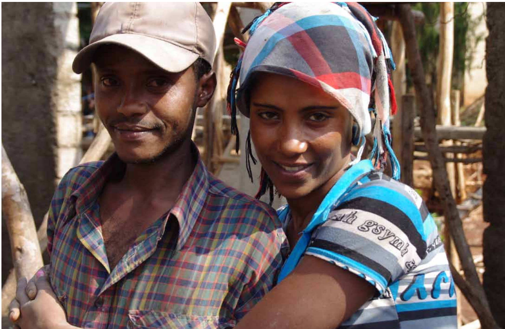
Etiopia - Giovani al lavoro in un cantiere a Emdibir / Aethiopien - Junge bei der Arbeit auf Baustelle in Emdibir