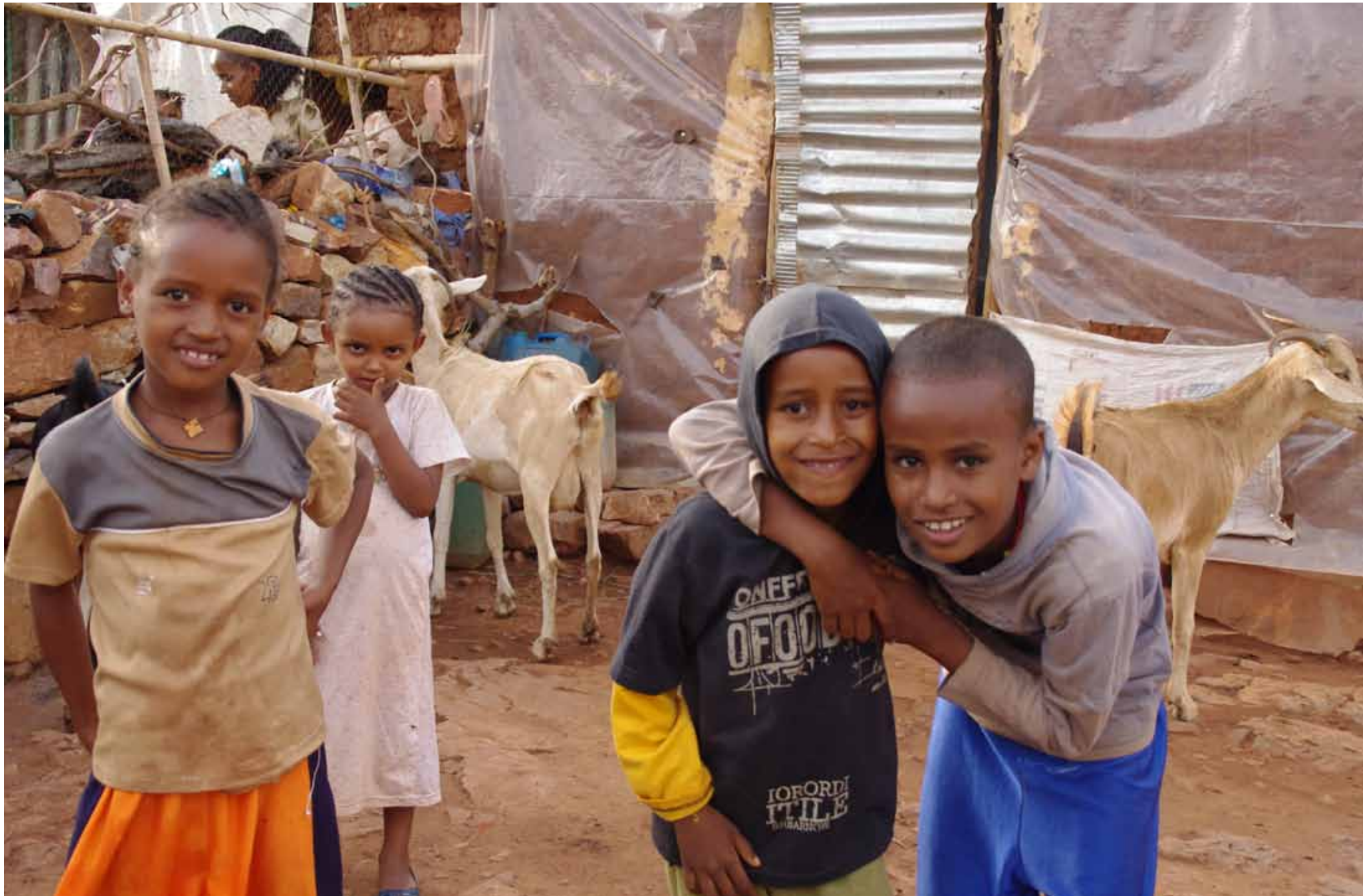
Etiopia - Bambini del campo profughi di Shire / Aethiopien - Kinder im Flüchtlingslager von Shire