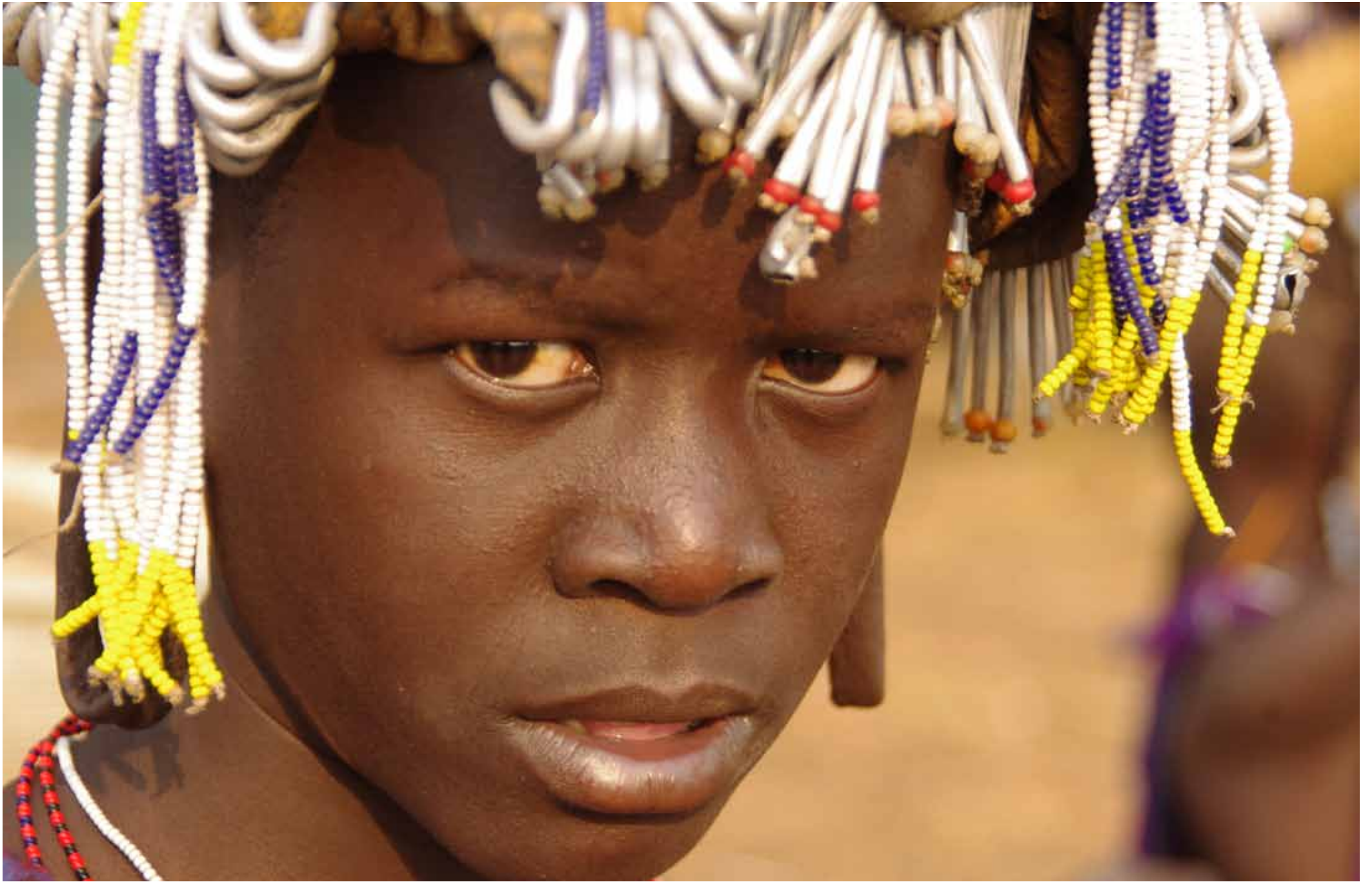
Etiopia - Ritratto di giovane ragazza Hamer / Aethiopen - Bildnis von jungen Mädchen Hamer