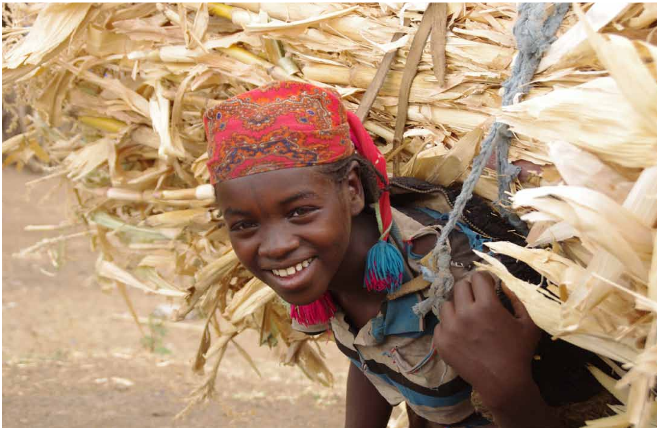
Etiopia - Ragazza di ritorno dal lavoro nei campi / Aethiopen - Mädchen auf dem Rückweg von der Arbeit