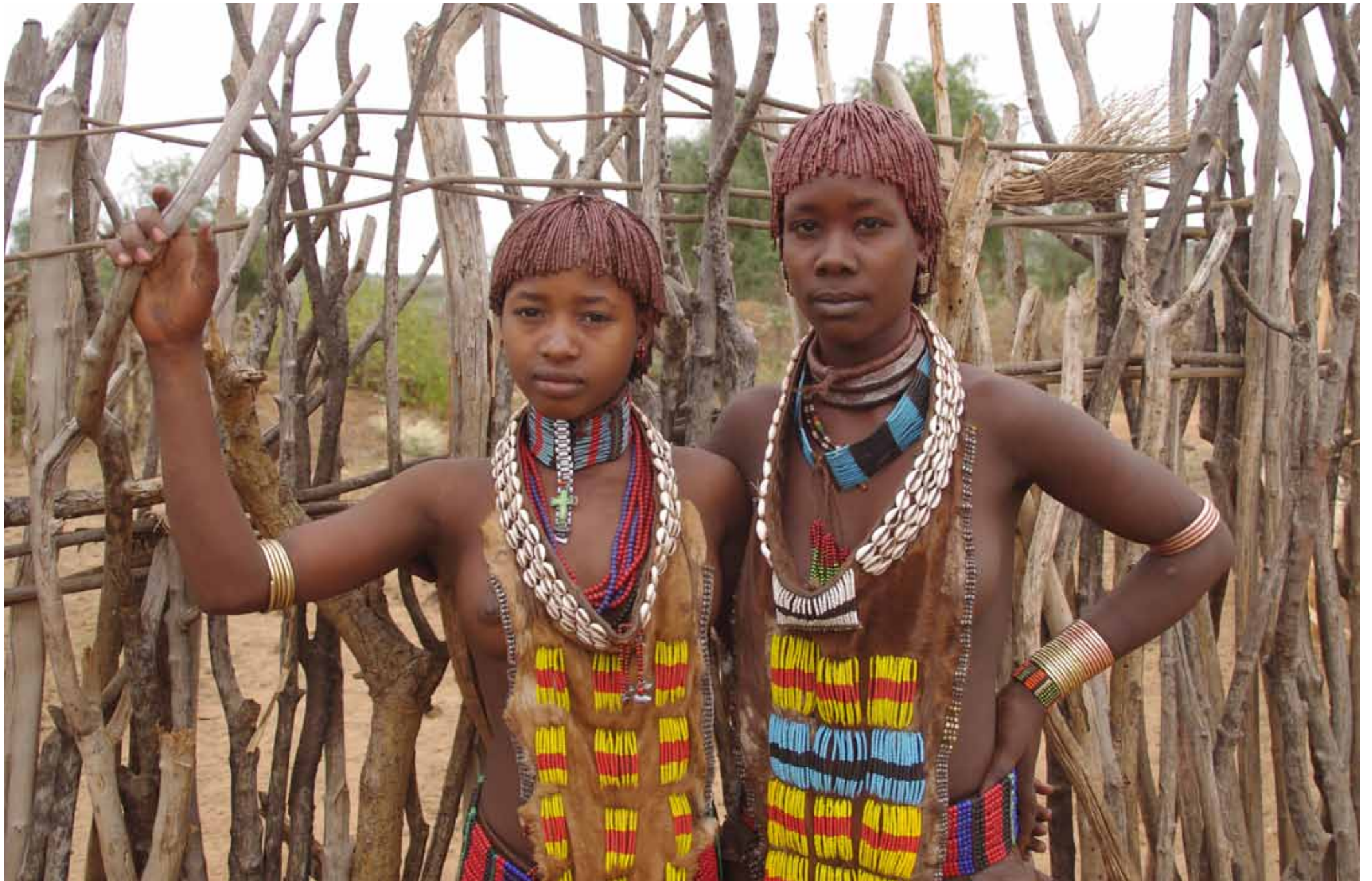
Etiopia - Ragazze Hamer della Valle dell'Omo / Aethiopien - Mädchen Hamer aus dem Omo-Tal