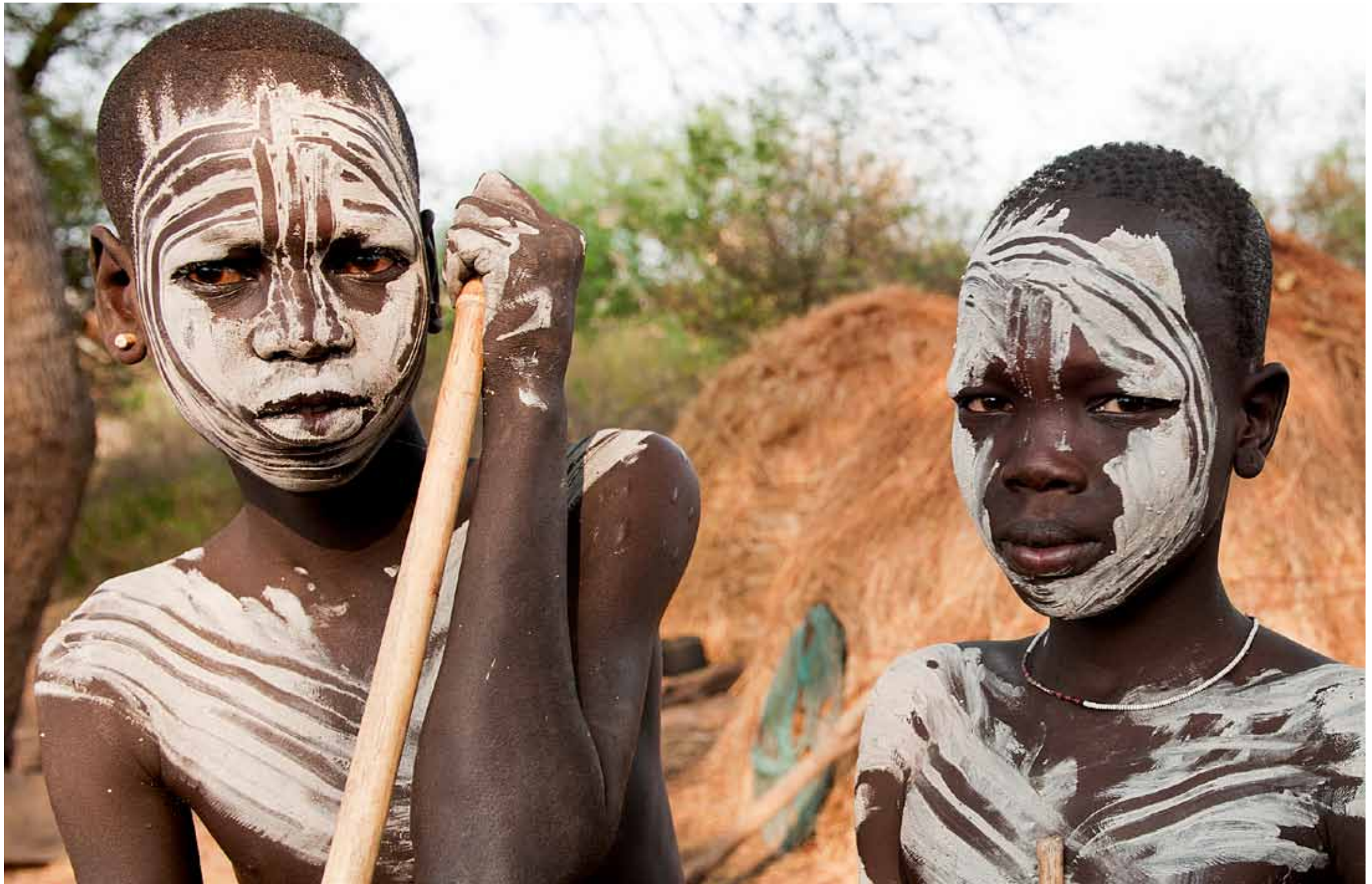
Etiopia - Valle dell'Omo, ragazzi di etnia Mursi / Aethiopen - Omo-Tal, Kinder der Völkergruppe Mursi