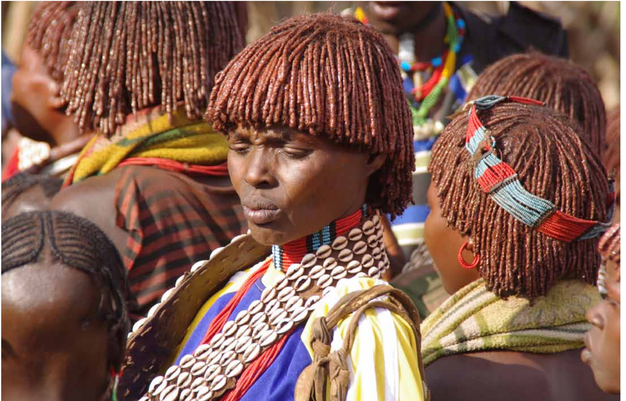
Etiopia - Donne Hamer della Valle dell'Omo / Aethiopien - Frauen Hamer aus dem Omo-Tal