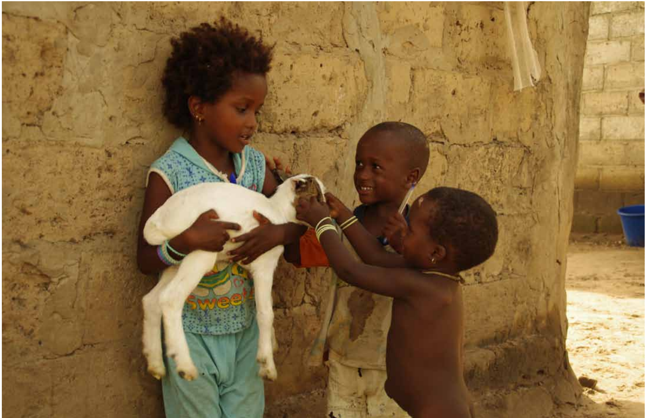
Etiopia - Bambini del campo profughi di Shire / Aethiopien - Kinder aus dem Flüchtlingslager von Shire